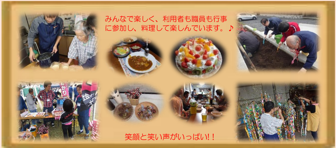
みんなで楽しく、利用者も職員も行事に参加し、料理して楽しんでいます。♪

サポートハウスゆとりではケアホーム・グループホームの利用者が共同生活されており、利用者ひとりひとりの主体性を尊重しながら日々の生活を笑顔で楽しく過ごされています。また、「地域とのつながり」を大切にしており、利用者が地域の方々との交流が持てるような活動や取り組みを行うことで地域社会に貢献したいと思っています。